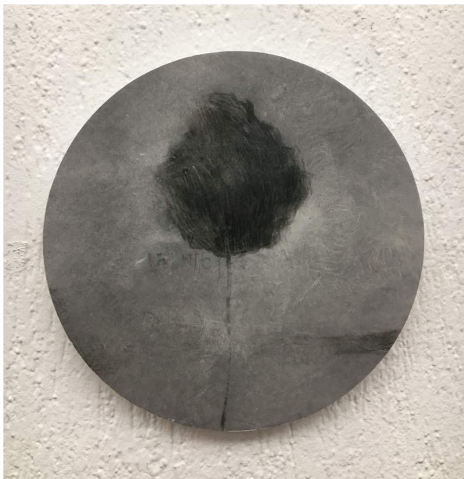
Fiori d'inverno, 2019