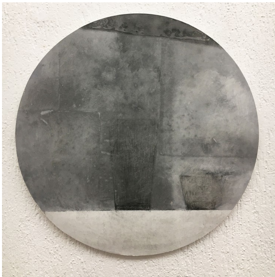
Fiori d'inverno, 2019

D eбора Fella nasce a Milano nel 1990. Frequenta il Liceo Artistico Boccioni di Milano e in seguito l'Accademia di Belle Arti di Brera con i proff. Renato Galbusera, Gaetano Grillo e Italo Bressan. Ottiene il diploma in Pittura. Attualmente insegna Discipline Pittoriche presso il Liceo Artistico Preziosissimo Sangue di Monza. Il suo lavoro si articola su un continuo dialogo tra l'esterno e l'interno dove l'immagine pittorica assume una forma visibile e allo stesso tempo indefinibile completamente. Il centro di questa ricerca si trova nell'equilibrio tra la figura e la sua dissoluzione, si tratta di uno studio sul colore (o non colore) fondato su una gamma cromatica di bianchi, neri e grigi, nel rapporto tra la materia e lo spazio, un lavoro fatto di velature che creano luci e ombre in grado di formare un'immagine dall'interno della pittura.