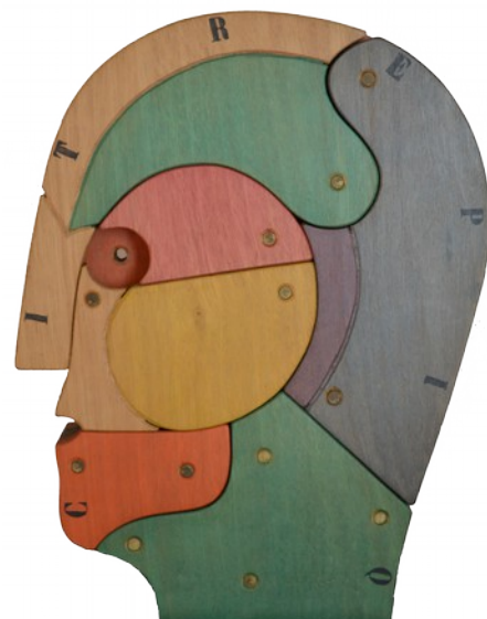
Citrepio legno okoumè dipinto 35x27x9 cm