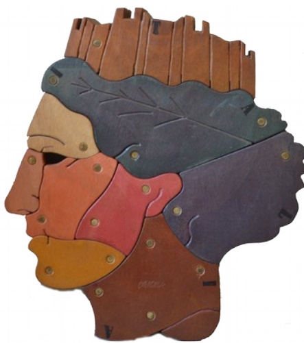
Italia legno okoumè dipinto 36x30x9 cm