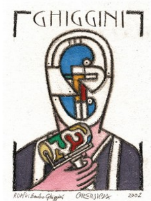
RDM di Emilio Ghiggini, 2002