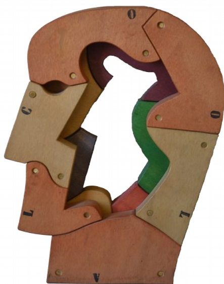
Alcool legno okoumè dipinto 42x29x9 cm

B runo Chersicla, pittore, disegnatore, scultore, jazzista nasce a Trieste nel 1937. Si diploma all'istituto d'arte e al Conservatorio della sua città per poi trasferirsi a Milano dal 1966. Nella sua esperienza di artista ha sommato alle radici mitteleuropee una precisione di rapporti matematici, rigore intellettuale e pulizia del design. Dagli anni '70 tralascia progressivamente la scenografia, la pittura e l'insegnamento per dedicarsi quasi esclusivamente alla scultura lignea, dando vita a forme ambigue e ambivalenti, sempre fedeli a una visione provocatoria ed ironica dell'espressione figurativa. Bruno Chersicla ha ottenuto nel 2001 il Guinness dei Primati realizzando in piazza dell'Unità d'Italia il dipinto più grande del mondo a Trieste. L'artista è scomparso nel 2013.